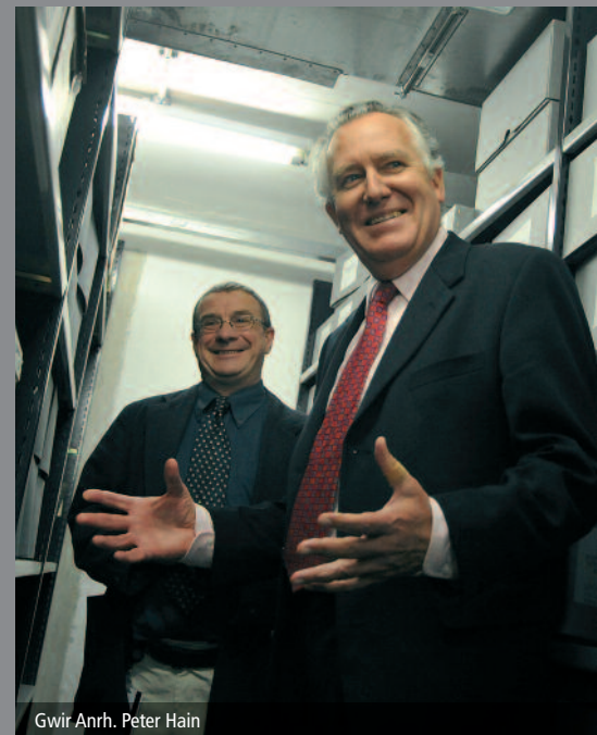
Gwir Anrh. Peter Hain