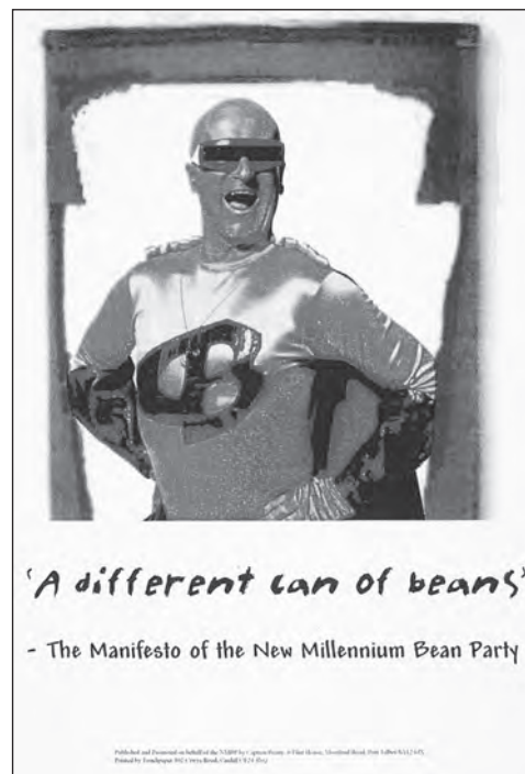
Anerchiad etholiad Cabden Beany, Canol Caerdydd, 2005

Diolch i gydweithrediad parod ein rhwydwaith o gysylltwyr yn y deugain etholaeth Gymreig a phencadlys Cymreig y prif bleidiau gwleidyddol, llwyddwyd i gasglu set bron yn gyflawn o’r manifestos, anerchiadau etholiadol a thafenni a gylchredwyd ledled Cymru yn ystod yr ymgyrch etholiadol diweddar drwy Ebrill a Mai 2005. Fe’u hychwanegwyd at Gasgliad Effemera Gwleidyddol Cymreig fel cyfres BA7, a bydd rhestr ohonynt ar gael ‘ar-lein’ yn fuan. Fel datblygiad newydd, aethpwyd ati hefyd i archifo safleoedd we y prif bleidiau gwleidyddol yn ystod ymgyrch yr etholiad.