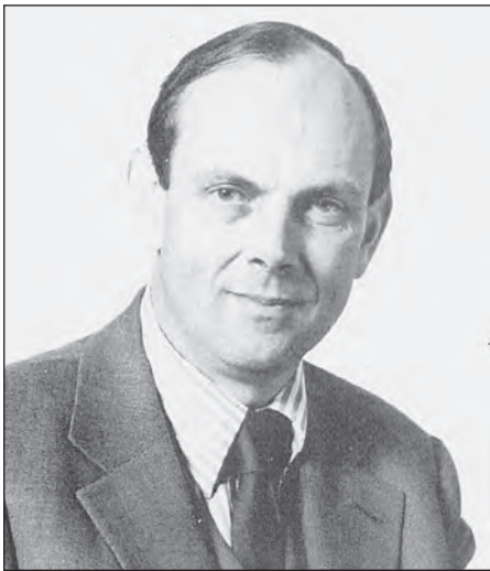
Yr Arglwydd Crickhowell

Bu'r Arglwydd Crickhowell hefyd mor hael â chytuno i dderbyn gwahoddiad i draddodi ugeinfed ddarlith flynyddol yr AWG yn y Llyfrgell ar 3 Tachwedd 2006.