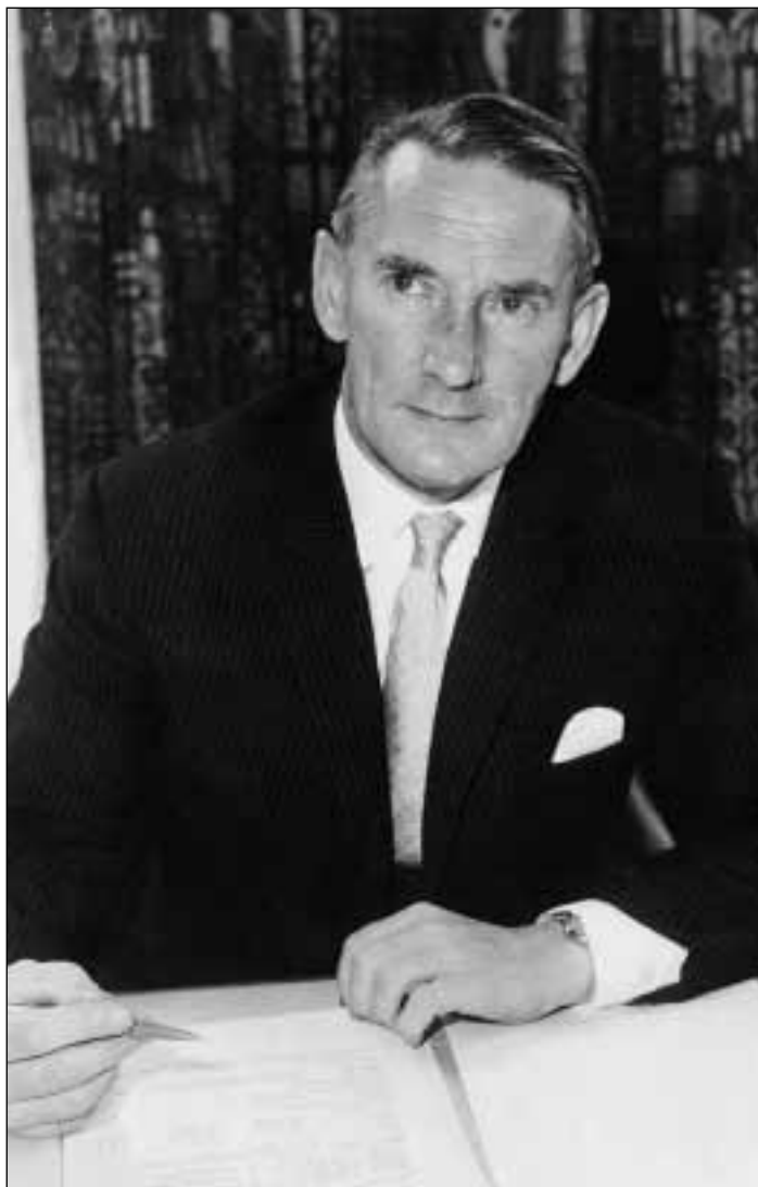
Goronwy O. Roberts ym 1967

Gobeithir gorffen trefnu a rhestri'r papurau yn y dyfodol agos. Rhannwyd hwy yn bedair cyfres tra'n catalogio: Dosbarth C (Gohebiaeth), Dosbarth S (Ffeiliau pwnc), Dosbarth P (Papurau personol) a Dosbarth Z (Deunydd printiedig a theipysgrif). Mae'r papurau yn gymar naturiol i nifer o archifau gwleidyddol eraill sydd eisoes yn eiddo i'r Llyfrgell a byddant yn ddi-os yn ffynhonnell o werth parhaol i haneswyr gwleidyddol.