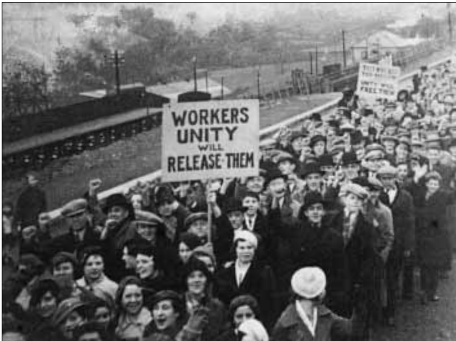
Gorymdaith 1936 yn pasio pull glo Taf Merthyr ar ei ffordd i Dreharris

Erbyn hyn llwyddwyd i orffen rhestrïr archif hon sydd yn rhedeg i 120 o flychau archifol. NMW