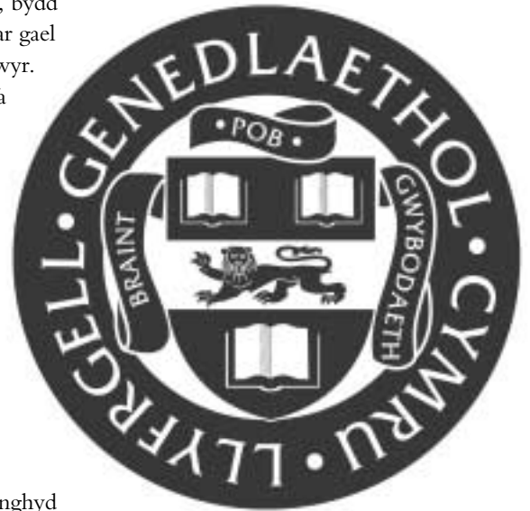
Logo newydd LLGC

Archif Sgrin a Sain a rhai o drysorau amhrisiadwy mwyaf nodedig y Llyfrgell.