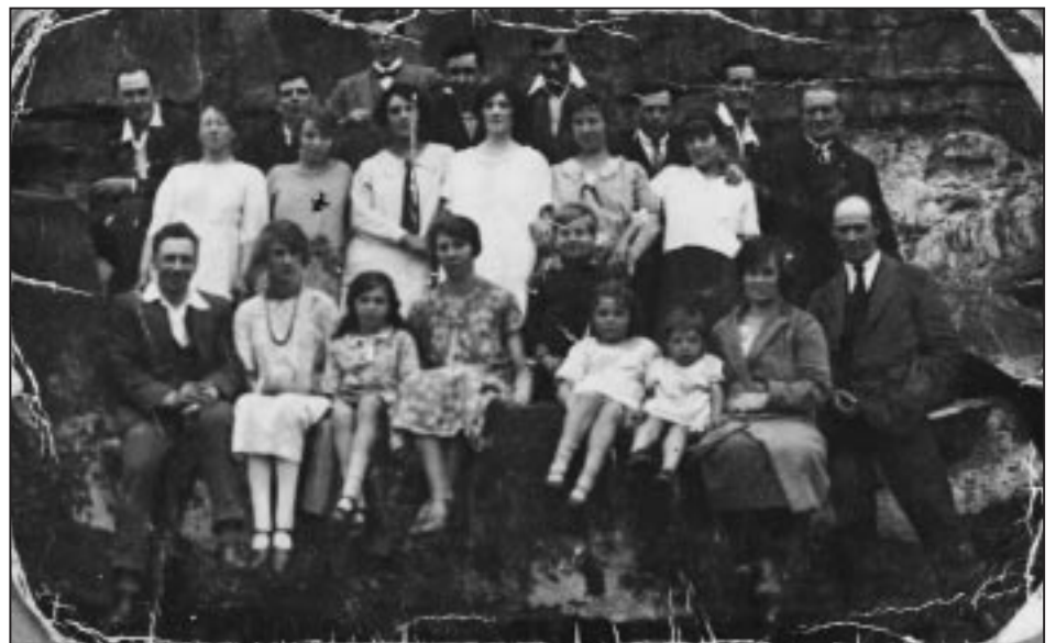
Plaid Gomiwnyddol Caerdydd yn 1925.

Derbyniwyd grŵp ychwanegol o bapurau Clive Betts , golygydd materion y Cynulliad gyda'r Western Mail , yn ymwneud yn bennaf â Chynulliad Cenedlaethol Cymru, 1998-2000.