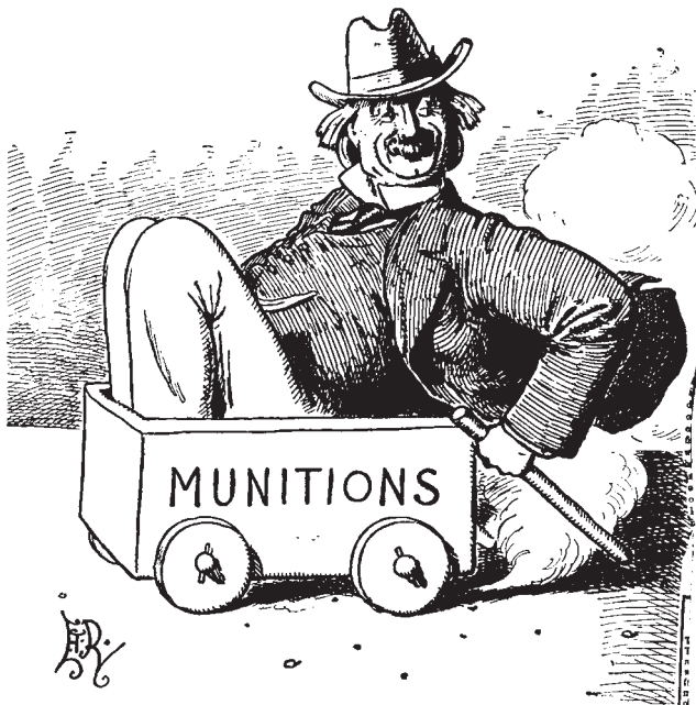
THE (PUSH-AND-) GO CART.

AT THE NATIONAL LIBRARY OF WALES AND OTHER REPOSITORIES