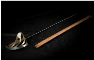
Y Cleddyf Mawr