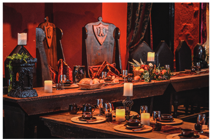
Gwledd yng Nghastell Rhuthun