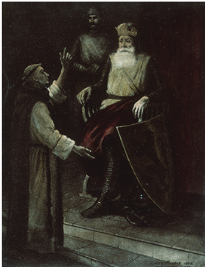
Yr Arglwydd Rhys

Cynhaliwyd yr Eisteddfod gyntaf yn 1176, yng Nghastell Aberteifi, sef cartref Yr Arglwydd Rhys. Mae hanes yr ŵyl i'w weld yn llawysgrif Brut y Tywysogion.